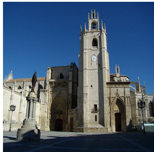
Catedral de San Antolín (Palencia)

A pesar de contar con importantes monumentos como la Catedral , una de las más grandes de España, el Cristo del Otero que es una de las imágenes de Jesús más grandes del mundo o cinco Monumentos Nacionales y singulares fiestas de gran interés como la Semana Santa o la Romería de Santo Toribio, Palencia no es una ciudad favorita para el turismo y aunque crece año a año el número de turistas lo hace muy lentamente.